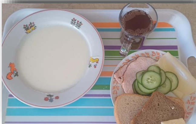
Dieta podstawowa - śniadanie