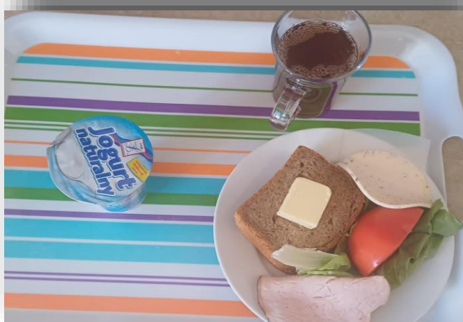
Dieta z ograniczeniem węglowodanów łatwoprzyswajalnych - śniadanie