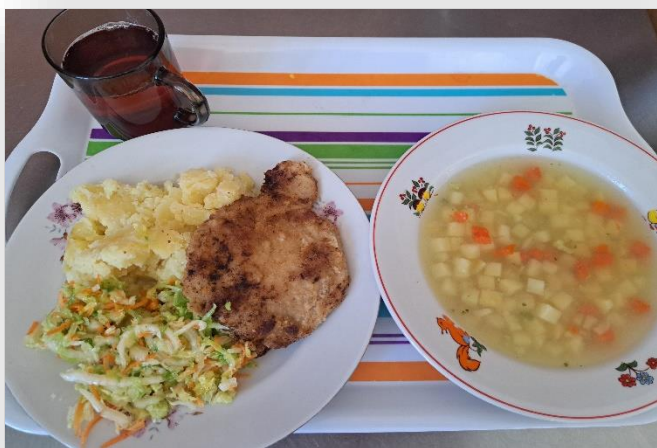
Dieta podstawowa - obiad